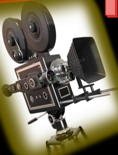
IMAGEN Y SONIDO