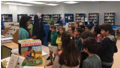
EXCURSIÓN A LA BIBLIOTECA DE BARGAS Y ARCHIVO MUNICIPAL. 4º ED. PRIMARIA