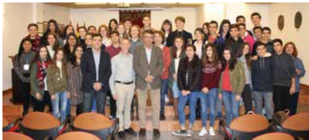
Napa Valley High School – IES Julio Verne, noviembre 2017