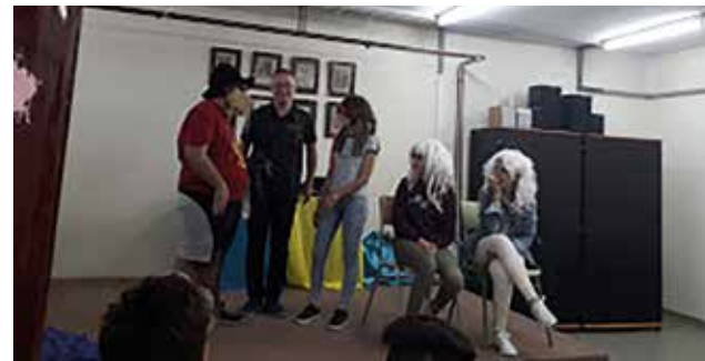
Storytelling por . Alumnos de 1ºPMAR y 2ºESO

Dichas actividades, llevadas a cabo en el centro, tanto con alumnos que pertenecen al programa bilingüe como con alumnos que no, tienen una aceptación notable, como lo muestran las imágenes.