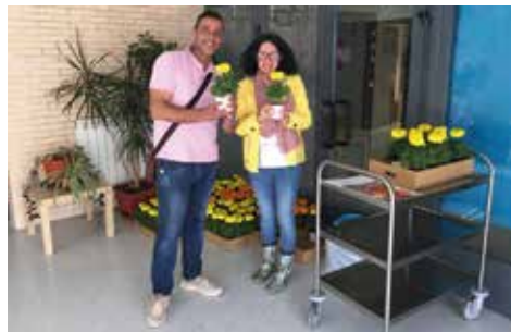
Junta Directiva del AMPA - III Certamen de Dibujo y Literatura

Recibid un cordial saludo, Junta Directiva AMPA Las Perdices.