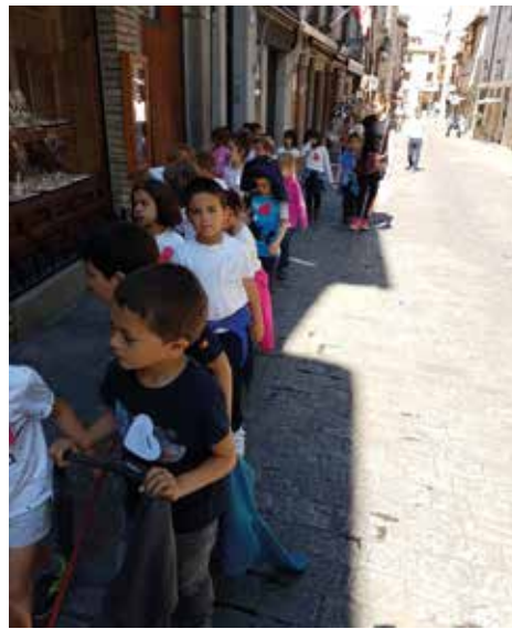
VISITA A ARQUEOPINTO (1º, 2º Y 3º DE PRIMARIA)