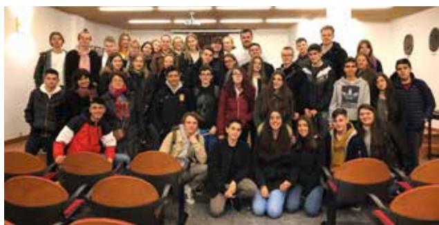
Akademi Båstad Gymnasium- IES Julio Verne, abril 2018